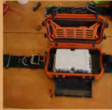
Perseguidor GPS de AbeewayTM habilitado por LoRa en una caja Pelican resistente al agua