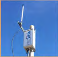
Antena y puerta de enlace de LoRa WAN