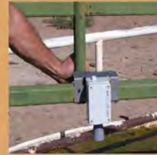
Sensor de DecentLab de nivel de agua en tiempo real habilitado de LoRa

Antena LoRa WAN, collar de perseguidor de AbeewayTM, sensor de nivel de agua y seguimiento en tiempo real de ganado a través GPS