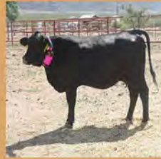
Vaca con collar de perseguidor GPS de AbeewayTM habilitado por LoRa